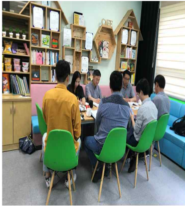
군·청년협의체 주거비용 등 회의개최